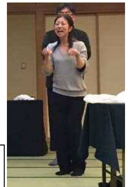
H29. 12. 23(土)忘年会 蓼科温泉ホテル親湯