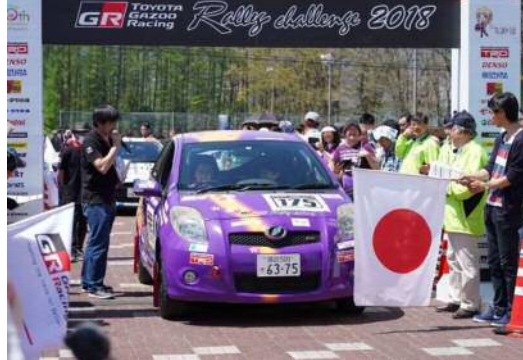
セレモニアルスタート