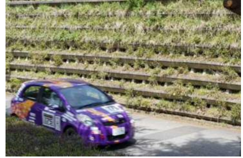
運動公園スペシャルステージでタイムアタック

女性コンビでの出場ということもあり、車両は女性らしさを表現した和風デザインに仕上げていただきました。短い準備期間でしたが、多くの方のご協力により、出場することができました。