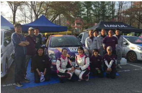
一日走り切りました！

女性コンビでの出場ということもあり、車両は女性らしさを表現した和風デザインに仕上げていただきました。短い準備期間でしたが、多くの方のご協力により、出場することができました。